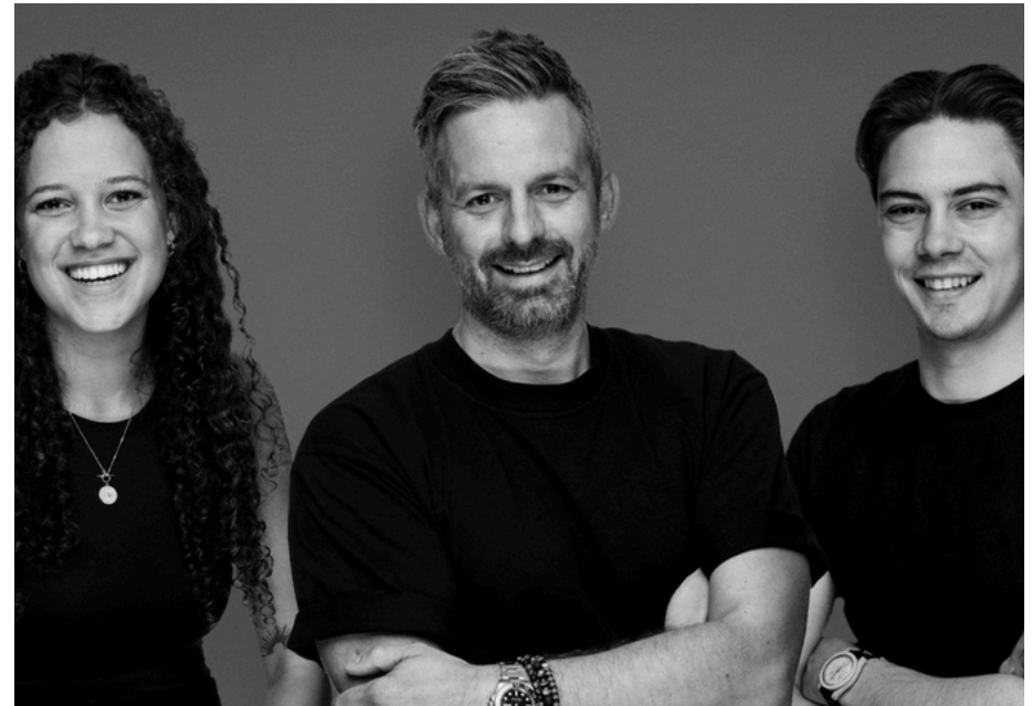
Manuel Paul Fotografie manuelpaul.com

Gutes Fotografieren ist vor allem Handwerk, das viel Kreativität, harte Arbeit, Ausdauer und ein wenig Glück erfordert. Ein gutes Bild entsteht nicht nur durch das Motiv, sondern durch die Idee und deren Umsetzung. Wichtig für mich ist, authentisch, ehrlich und spontan zu bleiben – das spiegelt sich in meinen Bildern wider, die klar, aussagekräftig und imposant sind.